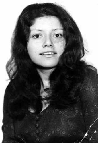
Mi mamá en 1974, un año después del Golpe Militar, cuando tenía casi mi misma edad y una de las pocas fotos donde aparece usando cabello largo.